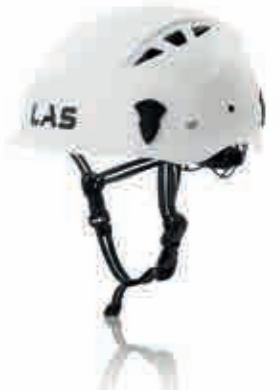
WHITE LW00020020 001