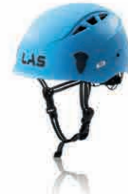
LIGHT BLUE LW00020020 026