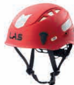
RED LW00010119 028