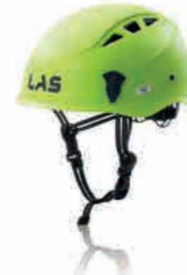
LIME LW00020020 029