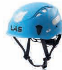
LIGHT BLUE LW00010119 026