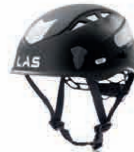
BLACK LW00010119 002