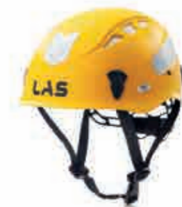
YELLOW LW00010119 024