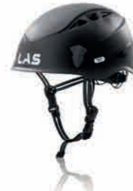
BLACK LW00020020 002