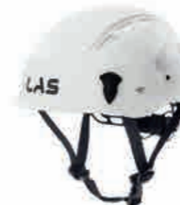
WHITE LW00010119 001