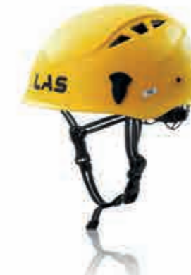
YELLOW LW00020020 024