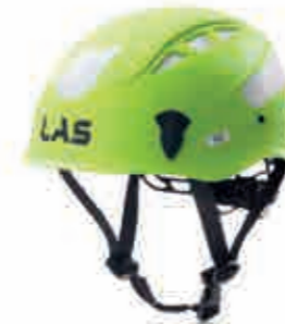
LIME LW00010119 029