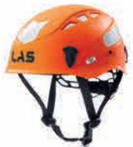
ORANGE LW00010119 025