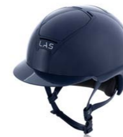
Blue/Matt Blue LH00170122 264