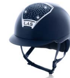
Matt Blue/Cromo/Crystal LH00171322 278

*** Disponibile anche con large visor Available also with large visor