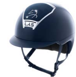
Matt Blue/Cromo LH00171422 014

*** Disponibile anche con large visor Available also with large visor