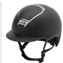
Matt Black/Cromo LH00170222 276