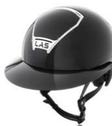
Black/Cromo LH00200923 293 Large Visor