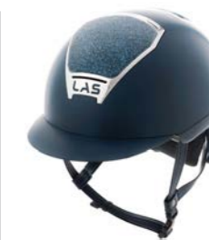
Matt Blue/Cromo/Crystal Blue LH00170823 320