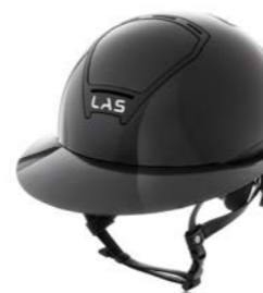
Black/Matt Black LH00200123 263 Large Visor