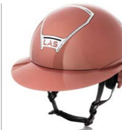
Antique Pink / Cromo Crystal