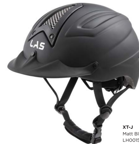
XT-J Matt Black LH00150120 004