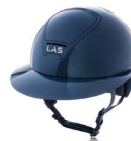
Blue LH00200023 055 Large Visor