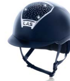
Blue/Cromo/Crystal LH00171322 291