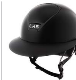
Matt Black/Black LH00200123 258 Large Visor