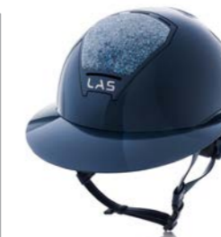
Blue/Crystal Blue LH00200823 368 Large Visor