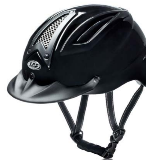
XT-E Black LH00150220 002