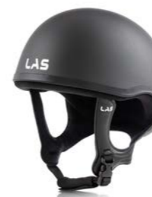
JC PRO Black LH00010019 002