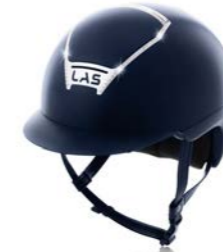
Matt Blue/Cromo LH00170922 278