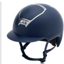
Matt Blue/Cromo LH00170222 278