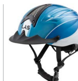
XT-E Light Blue - Blue LH00150220 146