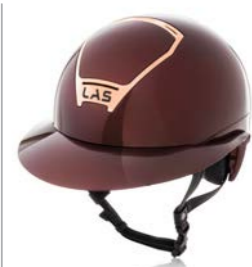
Dark Burgundi/Rose Gold