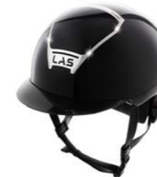
Black/Cromo LH00170922 293