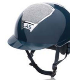
Blue/Cromo/Crystal LH00170822 291