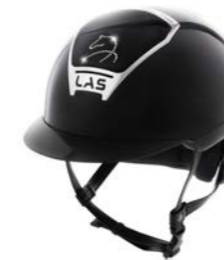
Black/Cromo LH00171422 031