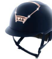
Matt Blue/Rose Gold LH00170922 275