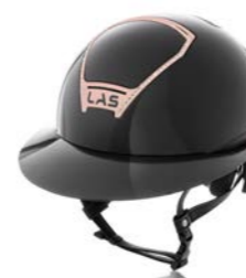
Black/Rose Gold LH00200923 294 Large Visor