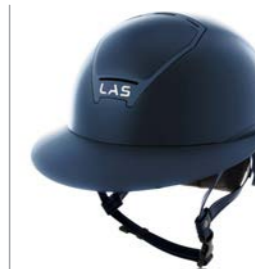
Matt Blue/Blue LH00200123 259 Large Visor

*** Disponibile anche con large visor Available also with large visor