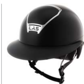
Matt Black/Cromo LH00200223 276 Large Visor