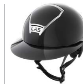
Black/Cromo LH00200223 293 Large Visor