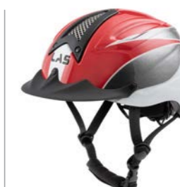
XT-E Red Antracite LH00150220 145