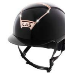
Black/Rose Gold LH00170922 294