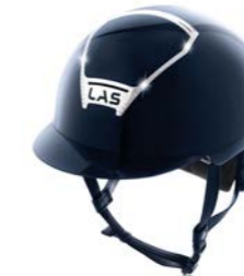
Blue/Cromo LH00170922 291