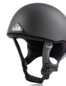
JC STAR Black LH00020019 002