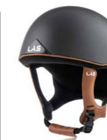
JC STAR Brown LH00020019 048