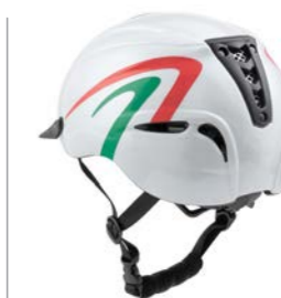
XT-E Italian Flag

Taglie S/M - L/XL solo Nero e Bianco Taglia S/M solo con grafica