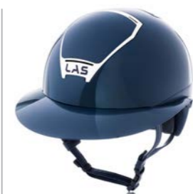
Blue/Cromo LH00200223 291 Large Visor