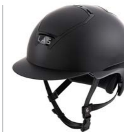
Matt Black/Black LH00170122 258