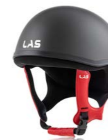
JC PRO Red LH00010122 006