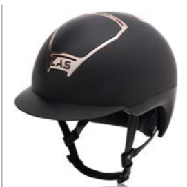
Matt Black/Rose Gold LH00170222 277