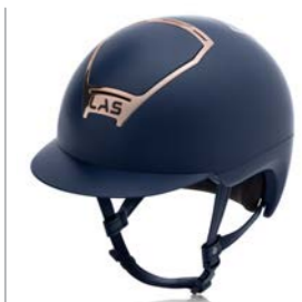
Matt Blue/Rose Gold LH00170222 275

*** Disponibile anche con large visor Available also with large visor