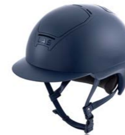
Matt Blue LH00170022 014