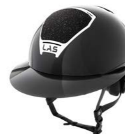
Black/Cromo/Crystal Black LH00200823 321 Large Visor