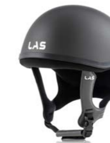
JC PRO Grey LH000100122 040