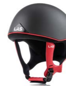
JC STAR Red LH00020019 006