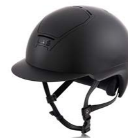
Matt Black LH00170022 004