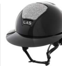
Black/Crystal LH00200823 031 Large Visor