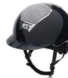
Black/Cromo/Crystal LH001708220 293