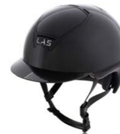
Black/Matt Black LH00170122 263