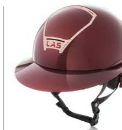
Burgundi / Rose Gold Crystal