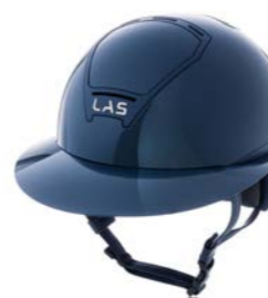
Blue/Matt Blue LH00200123 264 Large Visor