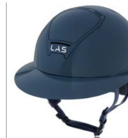
Matt Blue LH00200023 014 Large Visor

*** Disponibile anche con large visor Available also with large visor