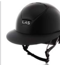
Matt Black LH00200023 004 Large Visor