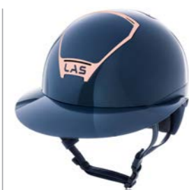
Blue/Rose Gold LH00200223 290 Large Visor