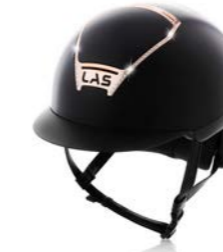
Matt Black/Rose Gold LH00170922 277