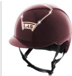
Dark Burgundi / Rose Gold Crystal