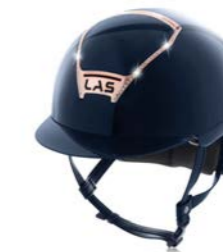
Blue/Rose Gold LH00170922 290