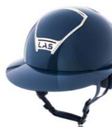
Blue/Cromo LH00200923 291 Large Visor

*** Disponibile anche con large visor Available also with large visor