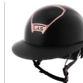
Matt Black/Rose Gold LH00200223 277 Large Visor