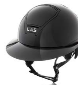
Black LH00200023 031 Large Visor