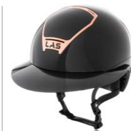
Blue/Rose Gold LH00200223 294 Large Visor