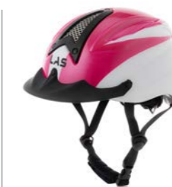
XT-E Pink White LH00150220 295