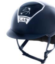
Blue/Cromo LH00171422 055