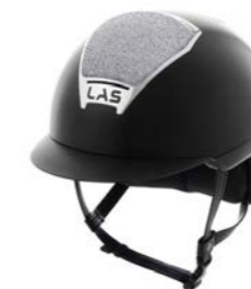
Matt Black/Cromo/Crystal LH00170822 276