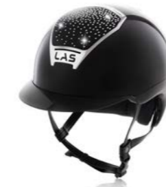
Black/Cromo/Crystal LH00171322 293