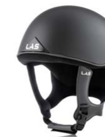
JC STAR Grey LH00020019 040