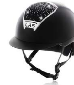
Matt Black/Cromo/Crystal LH00171322 276