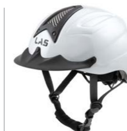
XT-E White LH00150220 001