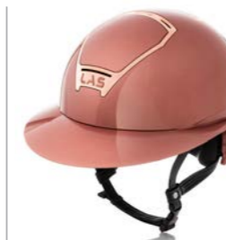
Antique Pink / Rose Gold