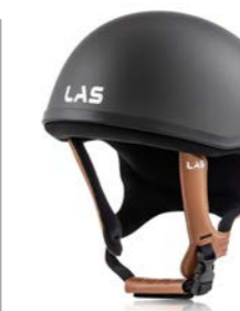
JC PRO Brown LH00010122 048