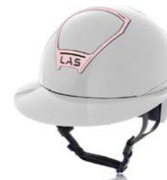
White/Rose Gold LH00200923 361