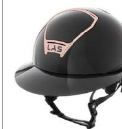
Black/Rose Gold LH00200923 294