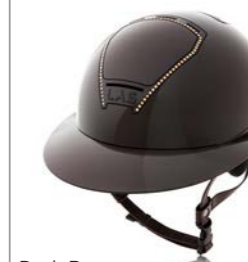
Dark Brown LH00200923 076