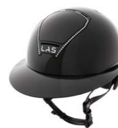
Black LH00200923 031