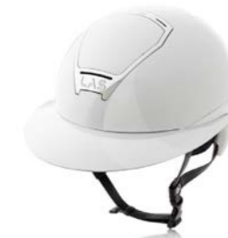
White/Cromo LH00200223 359