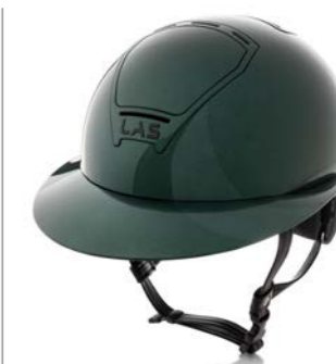
Dark Green LH00200023 075