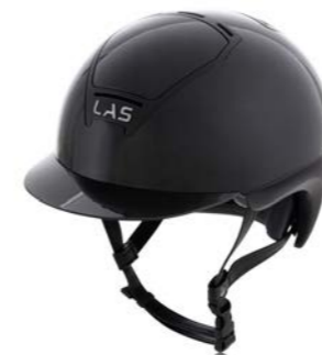
Black/Matt Black LH00170122 263