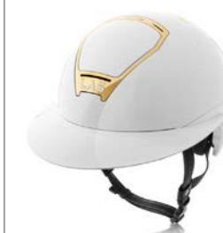
White/Gold LH00200223 396