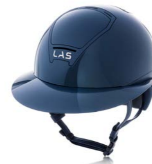
Blue LH0020023 055 anche OPACO/also MATT