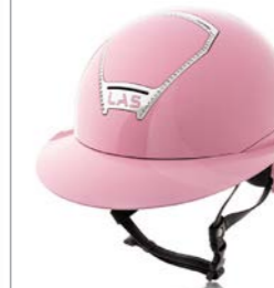
Pink/Cromo LH00200923 357