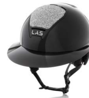
Black/Crystal LH00200823 031