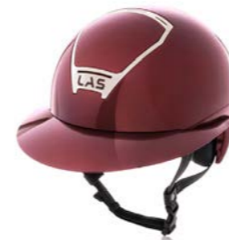
Burgundi/Cromo LH00200223 314