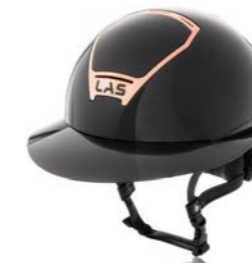
Black/Rose Gold LH00200223 294