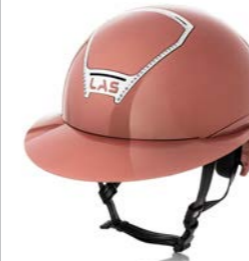
Antique Pink/Cromo LH00200923 367