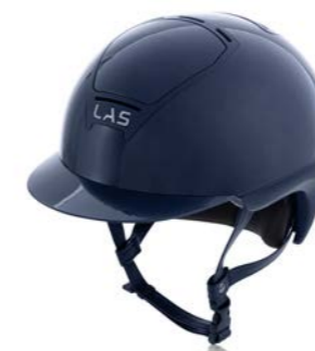
Blue/Matt Blue LH00170122 264