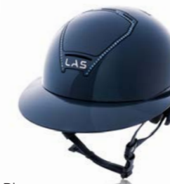
Blue LH00200923 055