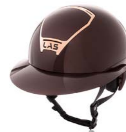
Dark Burgundi/Rose Gold LH00200223 364