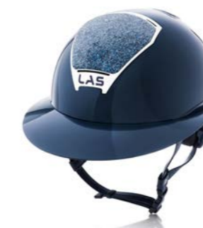
Blue/Cromo/Crystal Blue LH00200823 319