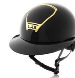
Black/Gold LH00200223 387