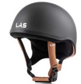
JC PRO Brown LH00010122 048