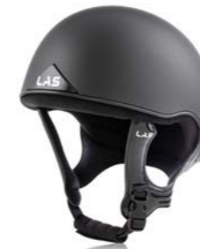
JC STAR Black LH00020019 002