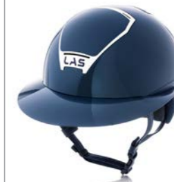
Blue/Cromo LH00200223 291