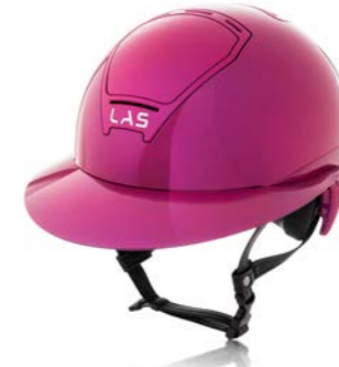
Fucsia LH002000023 008