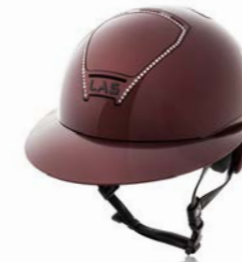
Burgundi LH00200923 067