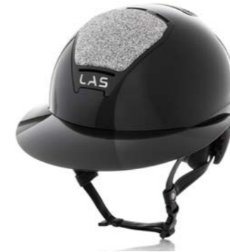
Black/Crystal LH00201323 031