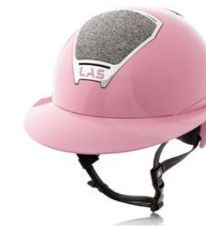
Pink/Cromo/Crystal LH00200823 365