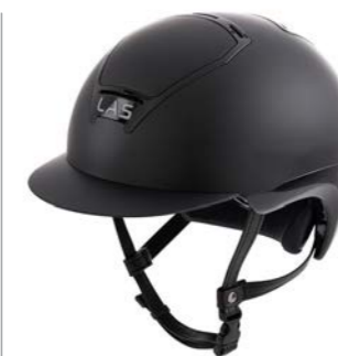
Matt Black/Black LH00170122 258