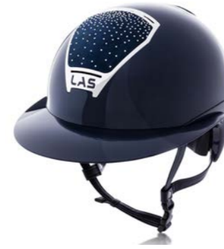
Blue/Cromo/Crystal Blue LH00201323 291