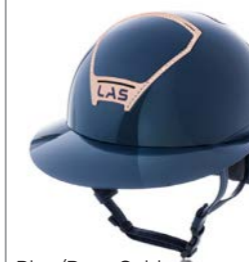
Blue/Rose Gold LH00200923 290