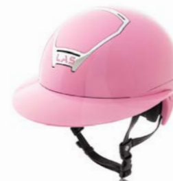
Pink/Cromo LH00200223 357