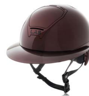
Dark Brown LH00200023 076