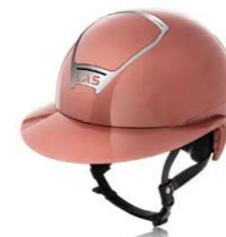
Antique Pink/Cromo LH00200223 367