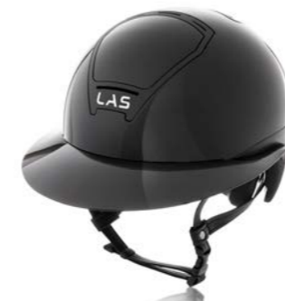
Black LH00200023 031 anche OPACO/also MATT