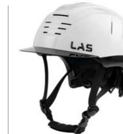
Explosion White LH00160022 001