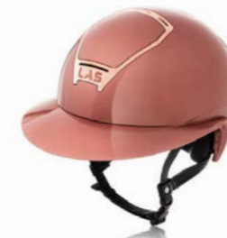
Antique Pink/Rose Gold LH00200223 360