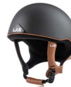
JC STAR Brown LH00020019 048