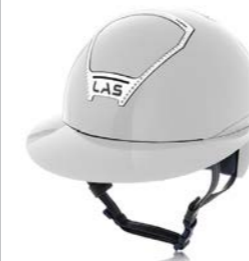
White/Cromo LH00200923 359