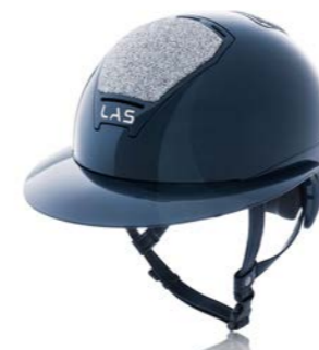
Blue/Crystal LH00200823 055