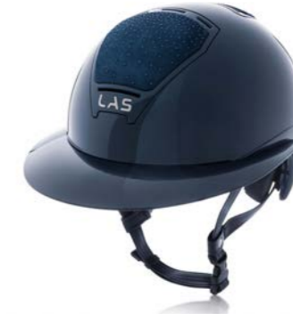
Blue/Crystal Blue LH00201323 368