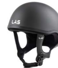
JC PRO Black LH00010019 002