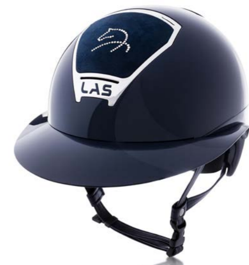
Blue/Cromo/Crystal LH00201423 055