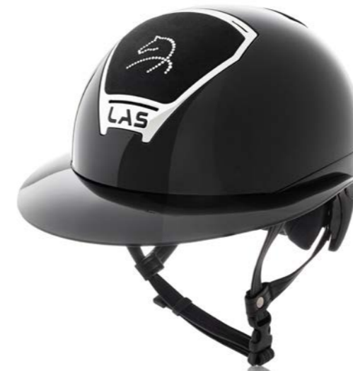
Black/Cromo/Crystal LH00201423 031