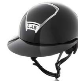
Black/Cromo LH00200223 293