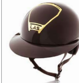
Dark Brown/Gold LH00200223 386