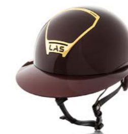
Dark Burgundi/Gold LH00200223 395