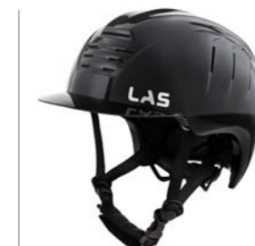
Pure Black LH00160022 002