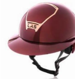
Burgundi/Rose Gold LH00200223 313