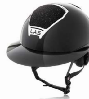
Black/Cromo/Crystal Black LH00200823 321