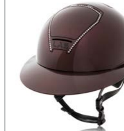
Dark Burgundi LH00200923 063