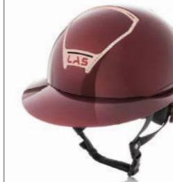
Burgundi/Rose Gold LH00200923 313