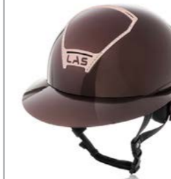
Dark Burgundi/Rose Gold LH00200923 364