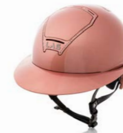
Antique Pink LH00200923 018