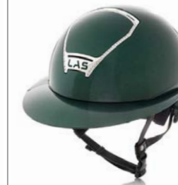
Dark Green/Cromo LH00200923