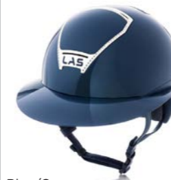
Blue/Cromo LH00200923 291