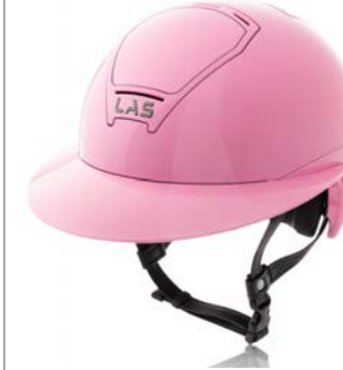
Pink LH00200023 027