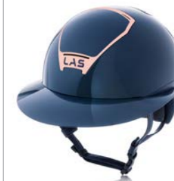
Blue/Rose Gold LH00200223 290