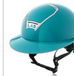
Turquoise/Cromo LH00200923 358