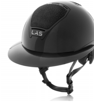
Black/Crystal Black LH00201323 346