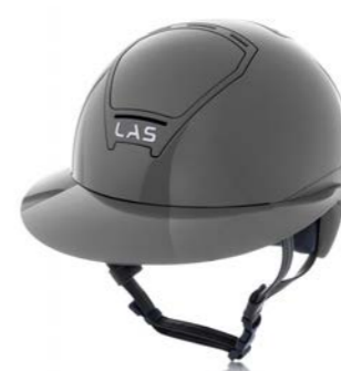
Grey LH00200023 065