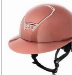
Antique Pink/Rose Gold LH00200923 360