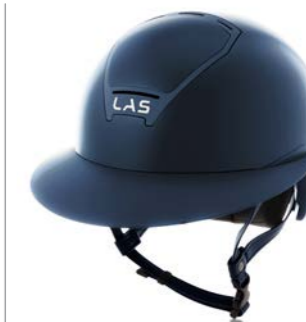
Matt Blue/Blue LH00200123 259