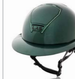
Dark Green LH00200923 075