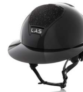
Black/Crystal Black LH00200823 346