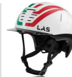
Bandiera Italia / It Flag