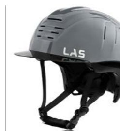
Rock Grey LH00160022 058