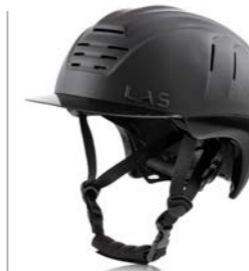
Matt Black LH00160122 004