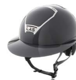
Grey/Cromo LH00200223 347