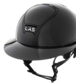
Black/Matt Black LH00200123 263