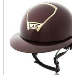
Dark Burgundi/Gold LH00200923 395