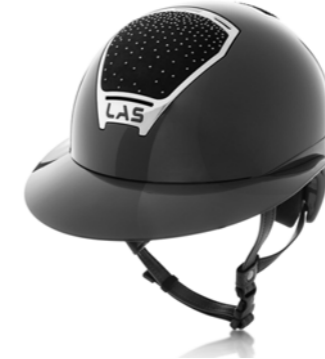
Black/Cromo/Crystal Black LH00201323 293