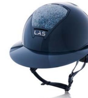
Blue/Crystal Blue LH00200823 368