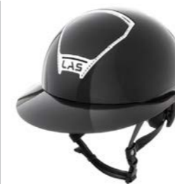
Black/Cromo LH00200923 293