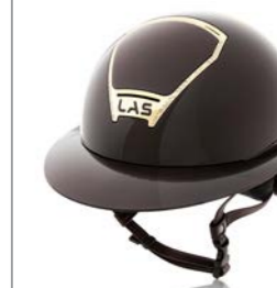
Dark Brown/Gold LH00200923 386