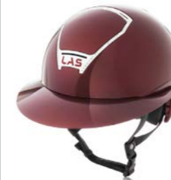
Burgundi/Cromo LH00200923 314