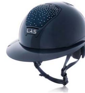
Blue/Crystal LH00201323 055