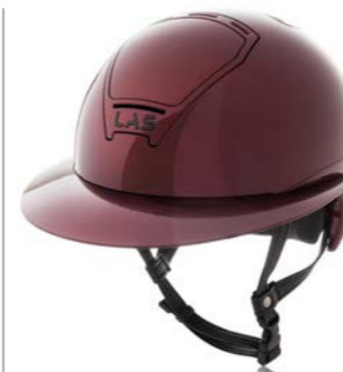
Dark Burgund LH00200023 063