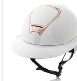
White/Rose Gold LH00200223 361