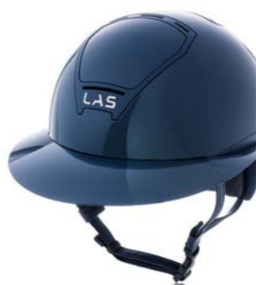
Blue/Matt Blue LH00200123 264