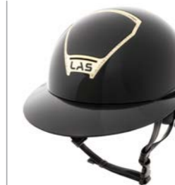
Black/Gold LH00200923 387