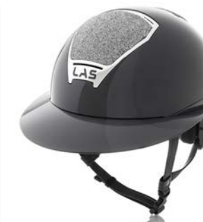
Grey/Cromo/Crystal LH00200823 382