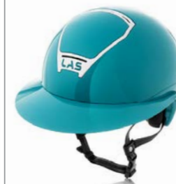
Turquoise/Cromo LH00200223 358